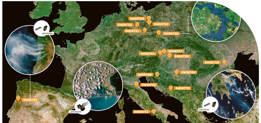
↑ Mapping-Aktivierungen zur Unterstützung von Notfallmaßnahmen zwischen 1. September und 8. Oktober 2024

Der Klimawandel hat sich dramatisch beschleunigt. Die letzten zehn Jahre waren ausnahmslos die wärmsten seit Beginn der Temperaturaufzeichnungen – mit 2024 als dem Jahr, in dem erstmals die globale Jahresmitteltemperatur mehr als 1,5 Grad Celsius über dem vorindustriellen Niveau lag. Mit der steigenden Temperatur nimmt auch die Feuchtigkeit der Atmosphäre zu, und zwar um etwa 7 Prozent pro Grad Celsius Temperaturänderung (Clausius-Clapeyron-Skalierung), zu beobachten auch in Deutschland, wo in den letzten 30 Jahren der Feuchtegehalt der Troposphäre in den Sommermonaten um rund 15 Prozent zugenommen hat. Mehr Wasserdampf in der Atmosphäre führt zu einem höheren Niederschlagsumsatz. Zudem liefert Wasserdampf durch Kondensationsprozesse die Energie für Gewitter. Insgesamt führt dies zu intensiveren Niederschlägen, insbesondere während der Sommermonate. Zusammen mit einem neuen Rekord bei der Meeresoberflächentemperatur des Mittelmeers herrschten im Jahr 2024 in weiten Teilen Europas während der Sommer- und Herbstmonate ideale Bedingungen für Starkregenereignisse. Dies führte zu verheerenden Überschwemmungen in ganz Europa, darunter das Hochwasser in Süddeutschland im